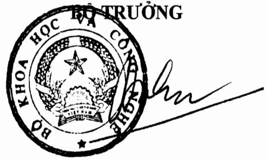
Chu Ngọc Anh